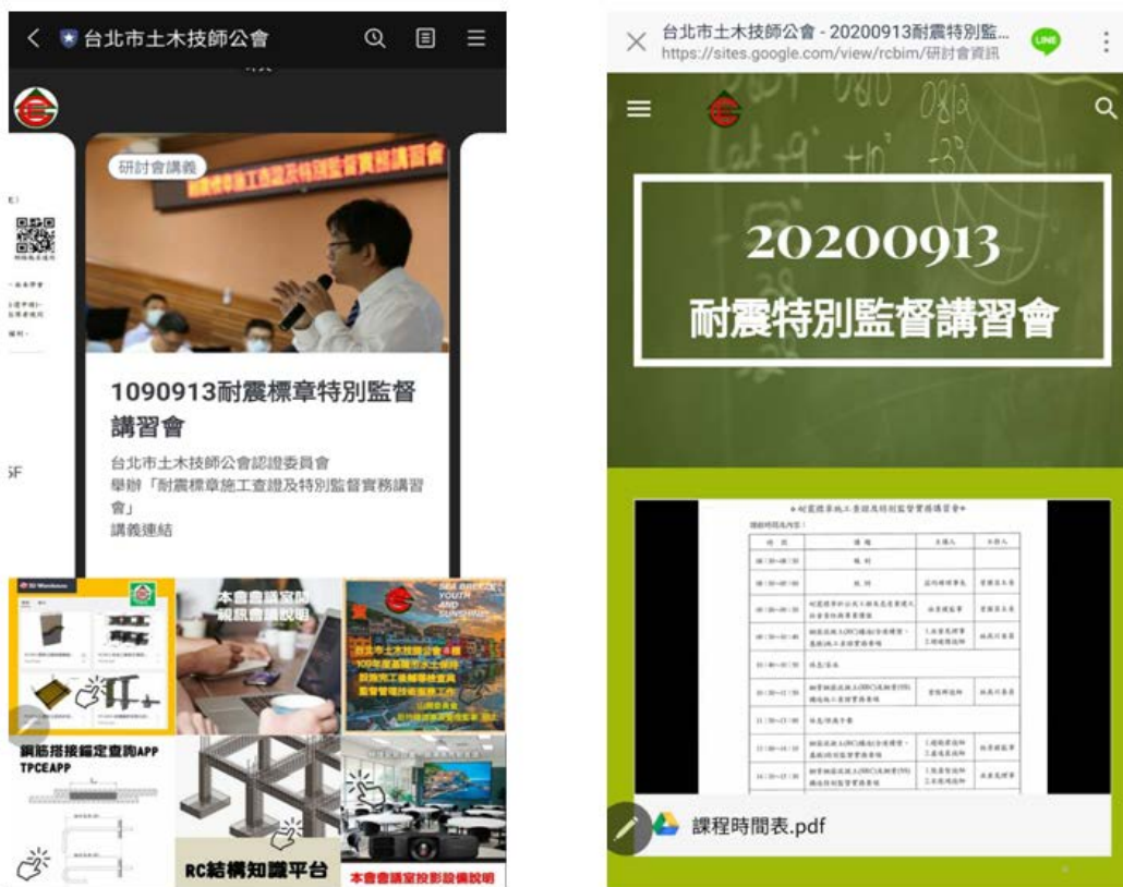
圖二 手機展示講習會講義分享