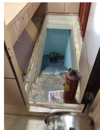
在不通風的地下室漆油漆。