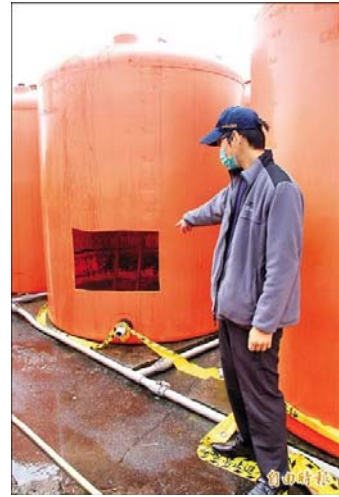
消防隊為了迅速救人，將肥料桶切割出一個方塊，將 2 名工人救出。

事業單位須依據規定設置職業安全衛生管理單位、委員會，依組織人數設置各種職業安全衛生業務主管、安全(衛生)管理師、