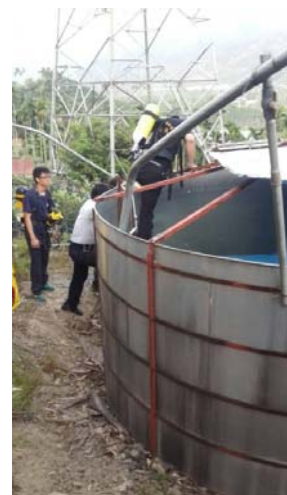
消防隊員戴氧氣瓶攀爬進入水塔內救人。