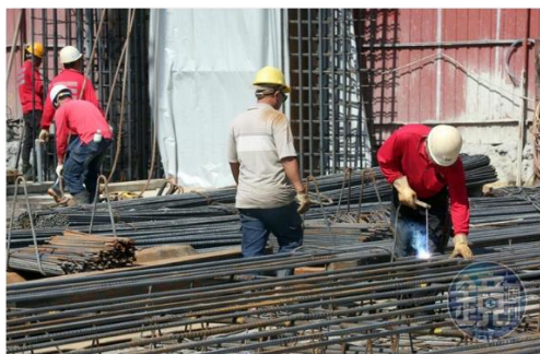
鋼筋加工作業(汗流浹背)

如今遇上傳染性肺炎疫情，每個人依規定還須配戴口罩，各位想想如以上所說的工作情境，還要戴上口罩是什麼滋味？筆者只是到現場進行施工查驗，爬個幾層臨時施工架樓梯，曬個幾小時太陽，口罩早已溼透一大半，呼吸都很困難，要努力的大口呼吸了！可是為了保護自己與他人，也只能乖乖的配合政策，一刻也不敢懈怠！