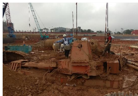
全套管基樁施作(場地泥濘)