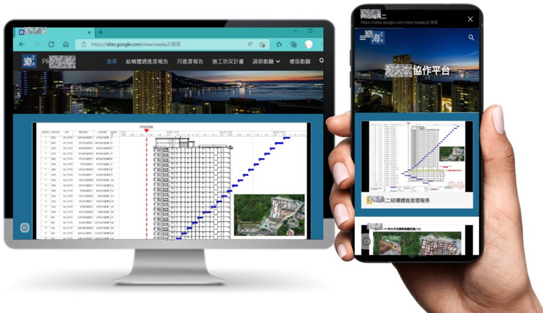
圖二 工務系統協作平台—設備共享資訊

另外，也推薦建置工務體系的 LINE@官方帳號，將其改造為機器人管家，放置入葛工地建案 LINE 群組內，俾供群組成員隨時呼叫機器人管家提供協作平台連結點，ANYWHERE、ANYTIME 地使用。